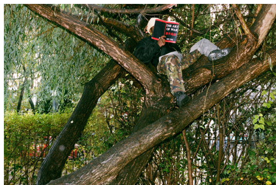
Hella Trees (2020) Ayo Akingbade 7 min.

A hand-painted, kinetic 16mm short about Taiwanese identity and historical memory. Experimental filmmaker and current CalArts student Erica Sheu retells Taiwan's colonial past, centering the nation as its own narrator.