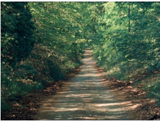
Quattro Strade (2021) Alice Rohrwacher 8 min.

Una delle figure visionarie del nuovo cinema italiano, lo stile di Alice Rohrwacher fonde un neorealismo rivitalizzato con il suo personale senso emotivo della fantasia, ed è acclamata a livello internazionale per i suoi lungometraggi Felice Lazzaro (Cannes miglior sceneggiatura 2018) e Le Meraviglie (Gran Premio Cannes 2014). Durante la quarantena, ha realizzato questo diario gentile e umanista con una pellicola 16mm scaduta trovata in casa, cercando di connettersi con i suoi vicini con l'aiuto del suo zoom.